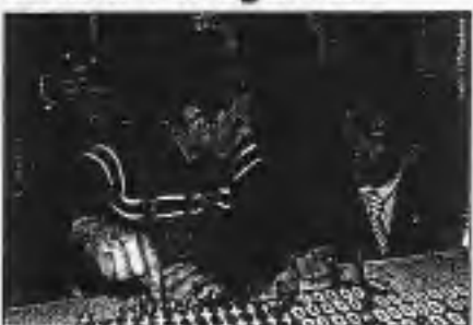
LH Jörg Haider überzeugte sich vom erfolgreichen Umbau in der Berufsschule 1 Klagenfurt.

Die umgebauten und erweiterten Tischler- und Kfz-Werkstätten in der Berufsschule 1 in Klagenfurt wurden im November feierlich durch Schulleiter Landeshauptmann Jörg Haider eröffnet. Die Kosten beliefen sich auf 1,4 Millionen Euro. Das Land setzt bewusst den Schwerpunkt darauf, der berufstätigen Jugend optimale Bedingungen zu schaffen und die Berufsausbildung zu perfektionieren. Kärnten zähle zu den drei wachstumstärksten Bundesländern und habe eine viel bessere Arbeitsmarktstatistik als andere Bundesländer. Insgesamt zählt das Berufsschulzentrum Klagenfurt, das drei Berufsschulen umfasst, 2.600 SchülerInnen. Eine weitere Baustufe am Berufsschulzentrum soll demnächst folgen.