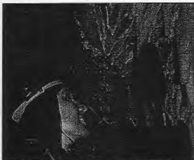
Klagenfurter Studenten drehten in den Obir-Tropfsteinhöhlen einen Werbespot.

Ausgewählt wurde der Ort wegen seiner bewegten Vergangenheit und der aktuellen touristischen Nutzung. Von Anfang des 15. Jahrhunderts bis 1900 war hier ein florierendes Revier für Bleibergbau. Die Stollen und Wege im Berg sollen eine Länge von rund 600 Kilometern aufweisen. Im Jahre 1991 wurde das Innenleben modern ausgestaltet und damit endgültig zum Besuchermagnet.