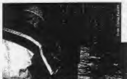
Von der Idee bis zur Endproduktion: Marketingvideos von der Obir-Tropfsteinhöhle.

Um ihre Ideen im Bereich des kreativen Marketings auch einmal in der Praxis umzusetzen, nehmen 20 Studenten der Alpen-Adria-Universität Klagenfurt, im Rahmen einer Lehrveranstaltung ihres Publizistik- und Kommunikationswissenschaften-Studiums an einem Projekt teil, bei dem ein Werbespot und ein Präsentationsvideo für die Obir-Tropfsteinhöhlen in Bad Eisenkappel gedreht wird.