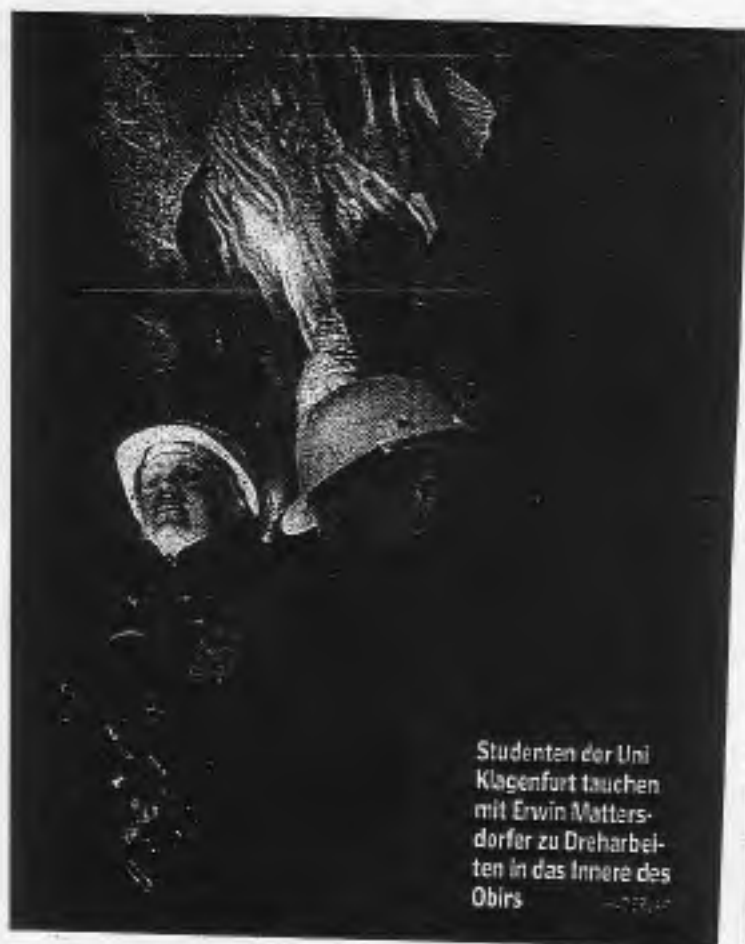
Studenten der Uni Klagenfurt tauchen mit Erwin Mattern- dorfer zu Dreharbei- ten in das Innere des Obirs