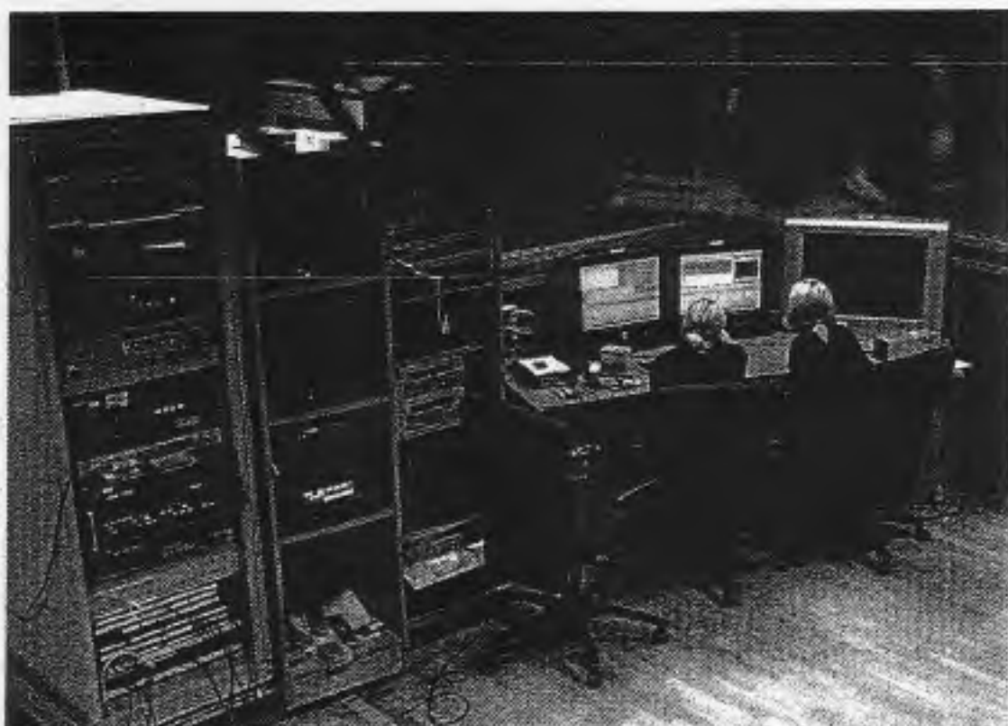
Das Filmstudio an der Klagenfurter Uni gibt es schon lange, nun soll es in den Blickpunkt der Öffentlichkeit rücken

Sie erreichen die Autorin unter astrid.kullnig@kleinezeitung.at