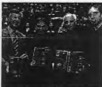
Der erste universitäre Werbeträger für eine Privatfirma ist fertig